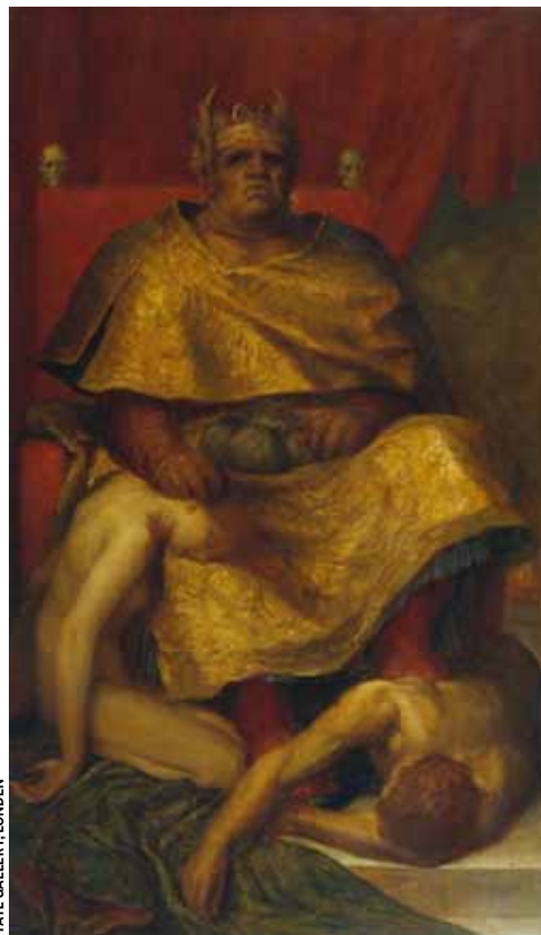
George Frederic Watts, Mammon, 1884-85

‘De Griekse schuldenproblematiek is puur theologie. We krijgen nog geld van ze. Of moeten we ze vergeven?’